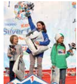
Podio Snowboard 2006F