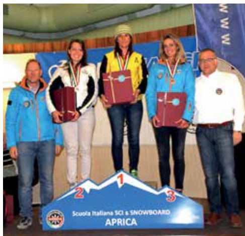
Podio Sci Alpino Femminile tempi corretti