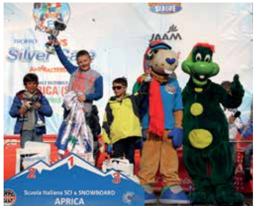
Podio Snowboard 2006M