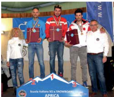
Podio Sci Alpino Maschile tempi corretti