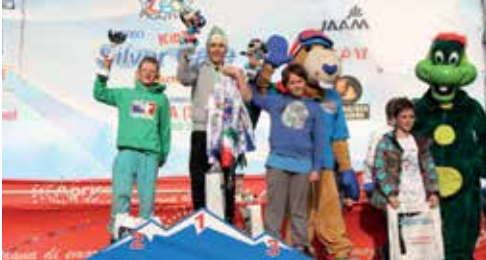
Podio Snowboard 2004M