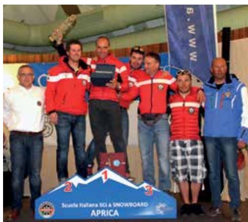
Scuola Sci Selva Val Gardena