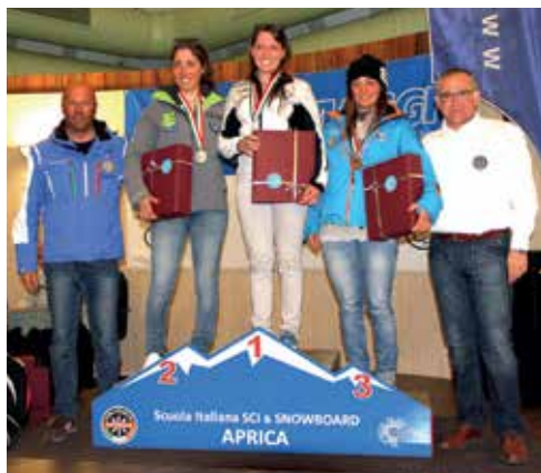
Podio Sci Alpino Femminile tempi effettivi